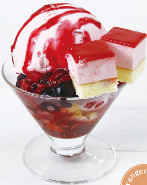
ベリーベリープチパフェ