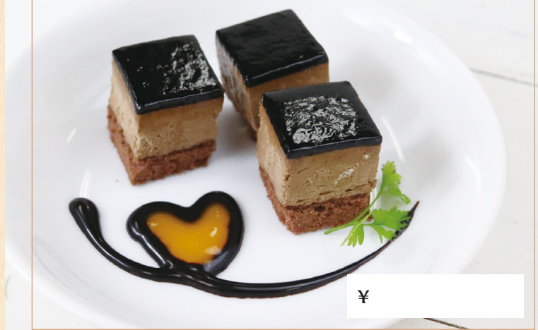
プチチョコレートケーキ