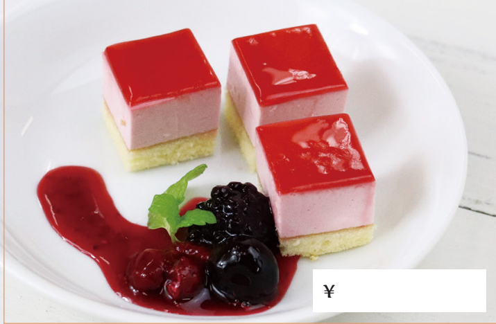
プチストロベリーケーキ