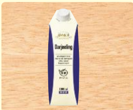
霧の紅茶 ダージリン 無糖 1000ml