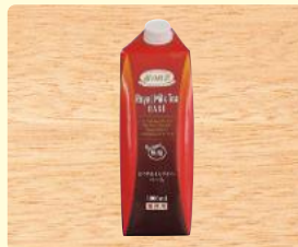
霧の紅茶 ロイヤルミルク ティーベース 無糖 1000ml