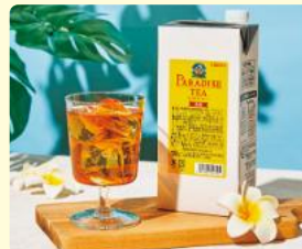
パラダイスティー 無糖 1000ml