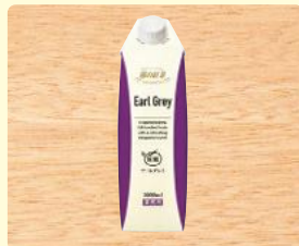
霧の紅茶 アールグレイ 無糖 1000ml