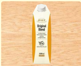
霧の紅茶 オリジナルブレンド 無糖 1000ml

氷を入れてそのままでも簡単アレンジでも紅茶の風味を感じられるよう濃く抽出しています。